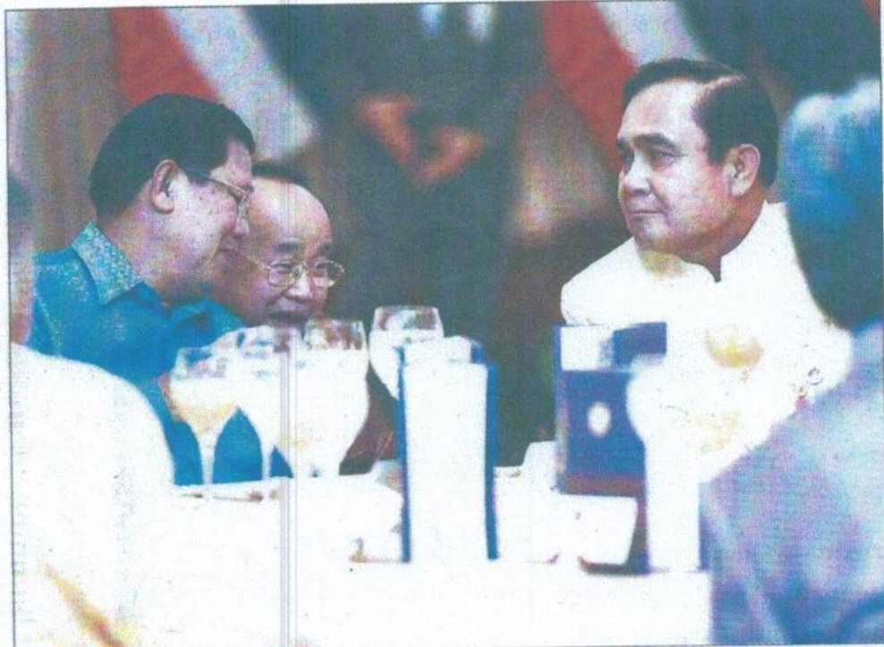
▲ มิตรประเทศ : พล.อ.ประยุทธ์ จันทร์โอชา นายกรัฐมนตรี เป็นเจ้าภาพเลี้ยงอาหารกลางวันแก่สมเด็จฮุนเซ็น นายกรัฐมนตรีกัมพูชา และคณะ หลังแล้วเสร็จการประชุมครบ. 2 ชาติ ร่วมกัน ณ ตึกสันติไมตรี ทำเนียบรัฐบาล

ด้าน สมเด็จฮุนเซ็น กล่าวว่า มีความภูมิใจอย่างยิ่งในความร่วมมือของ 2 ประเทศ สิ่งที พล.อ.ประยุทธ์ พูดมานั้น เป็นสิ่งที่จะขยายความสัมพันธ์และความร่วมมือกันต่อไป ทั้งทางด้านการค้าการส่งออกระหว่าง 2 ประเทศ ซึ่งที่ผ่านมา มีมูลค่ากว่า 5 พันล้านดอลลาร์สหรัฐ โดยเป็นการส่งออกจากไทยไปกัมพูชา 4,500 ล้านดอลลาร์สหรัฐ ส่วนกัมพูชาส่งออกมายังประเทศไทย 500 ล้านดอลลาร์ ซึ่งรัฐมนตรีว่าการกระทรวงพาณิชย์ของ 2 ประเทศได้ตกลงไว้ว่าในปี 2563 จะเพิ่มมูลค่าการค้าขายระหว่างกันเป็นจำนวน 1.5 หมื่นล้านดอลลาร์สหรัฐ รวมถึงจะมีการอำนวยความสะดวกในการเดินทางระหว่างกันมากขึ้น อาทิ การเพิ่มด่านชายแดน และการทำเส้นทางรถไฟระหว่างกัน